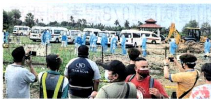
■当局拉起警戒线，亲友不能靠近，只能远观下葬仪式。