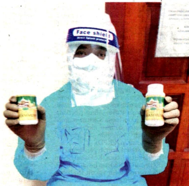
Azmizam yang lengkap berpakaian PPE menunjukkan botol debu tayamum yang boleh didapati pada harga RM15.

Selain itu, katanya, sanitasi jenazah pula dilakukan pihak