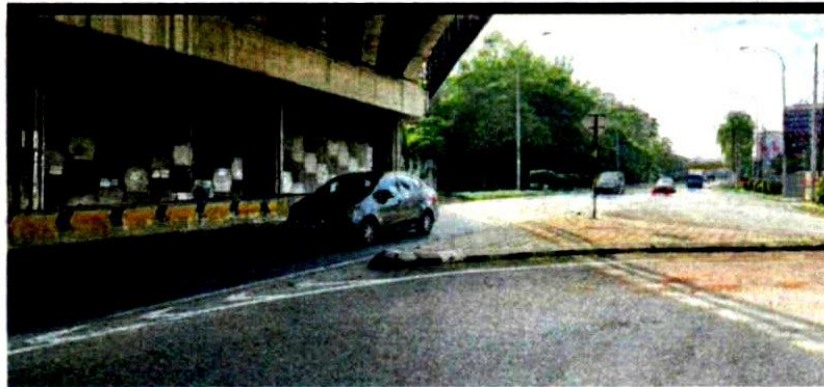
This site along Jalan Sungai Long is said to be an accident-prone area.