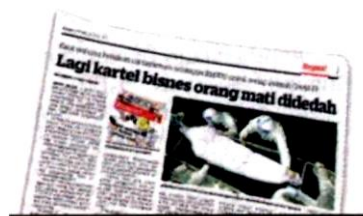
KERATAN Kosmo! 22 Julai 2021.

Beliau yang juga Penaung Unit Khas Van Jenazah (UKVJ) memberitahu, pihak tidak bertanggungjawab telah mengenakan caj untuk proses tayamum hanya dilakukan di atas beg mayat di bahagian muka dan dua tangan serta solat jenazah.