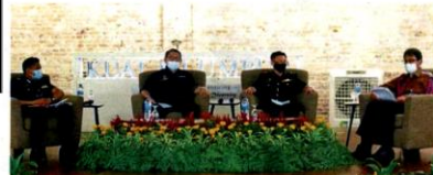
A DBKL webinar in April discussed breach of trust and misappropriation of funds at residential highrise buildings and housing projects.

"This event was jointly organised with Kajang Municipality Community Organisation, which had invited experts from various fields," he added.