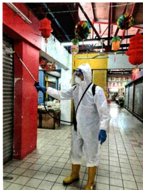
■ 万达镇行动队已前往巴刹展开消毒。

“我们就要求暂时关闭，以在关闭期间彻底消毒，同时会在在巴刹发布通告，告知大家我们下周一将一连4天关闭。”