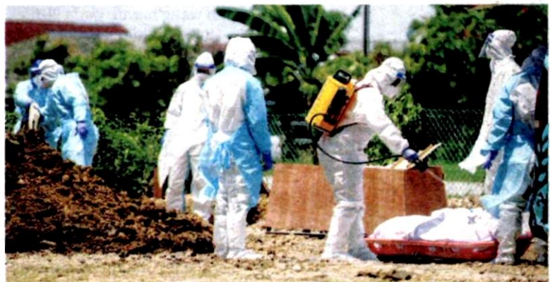
PENGURUSAN jenazah Covid-19 di Tanah Perkuburan Islam Selat Kelang, Klang, Selangor bulan lalu.

“Ketika inilah kartel jenazah Covid-19 akan ambil kesempatan menyantuni waris semasa di hospital kerana dalam fikiran waris yang sedang bersedih mereka hanya mahu pastikan jenazah yang disayangi dikebumikan dengan segera,” katanya dalam hantaran di laman Facebook rasminya semalam.