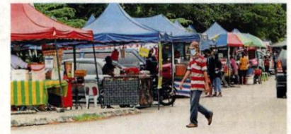
许多路边摊依然客似云来, 非常热闹。

他指出, 入院使用氧气及其它药物, 可能有帮助, 但是家属对冠病的认识严重不足, 又对政府医院存有误解及不信任, 导致死亡病例增加。