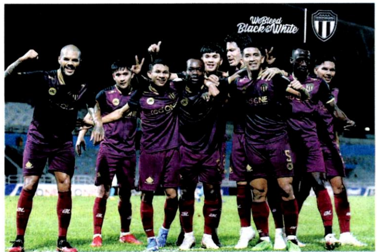
TFC berjaya meraih mata penuh selepas menundukkan PJ City pada aksi yang berlangsung di Stadium Majlis Bandaraya Petaling Jaya kelmarin.