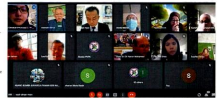
Screenshot of MPKJ's webinar on Covid-19, which touched on vaccination and mental health challenges.