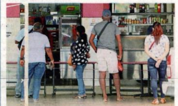
尽管病例高居不下, 食肆确诊也频频, 但许多巴生人依然外出打包。