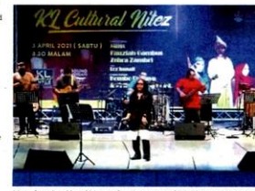
Mass from local band May performing at one of DBKL's concerts in April which was streamed live on its Facebook page.