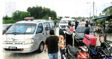
■排队进入墓园，引起民众围观，多辆灵车在执法人员开路下。